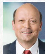
Andreas Schefer Präsident SRG Deutschschweiz, Bern