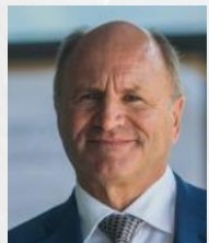
Hans-Peter Metzler Präsident Bregenzer Festspiele